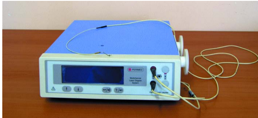
Figure 2: Laser Doppler Flowmetry device.

zamanında elde edilen değerler (T1-3), Windows ortamında SPSS Ver.10.0. istatistik ölçümleri paket programından yararlanılarak değerlendirilmiştir. Ölçüm zamanlarına göre her hastadan elde edilen değerleri kendi içerisinde karşılaştırmak için tekrarlı ölçümlerde varyans analizi kullanılmıştır. Yapılan analiz neticesinde farklılığın anlamlı bulunduğu sonuçlarda farklılık gösteren ölçüm zamanlarının belirlenmesinde ise Tukey testi kullanılmıştır.